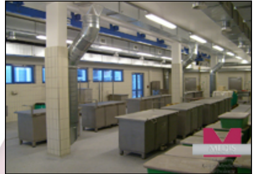
MA-2057 Küvetten im Institut für Vet.- Anatomie der JLU Gießen

Hergestellt in Deutschland von MEDIS MT GmbH gemäß ISO 9001 und den gültigen EN-Normen sowie Arbeitsschutz- und Sicherheitsbestimmungen