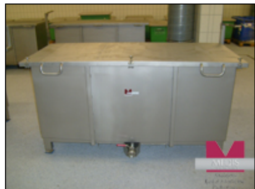
MA-2057 Küvette mit Deckel