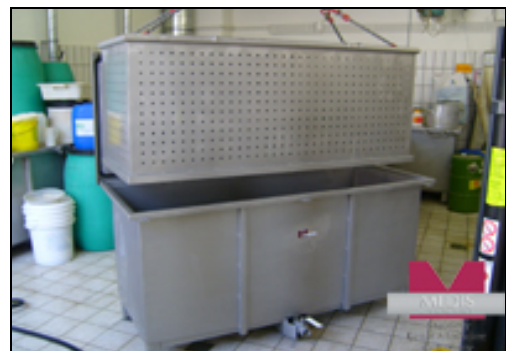
MA-2057 Küvette mit großem Korbeinsatz