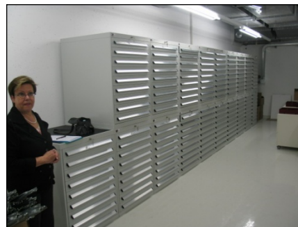
„HistoFile“ – Anlage für ca. 0,5 Mio. Gewebeblöcke