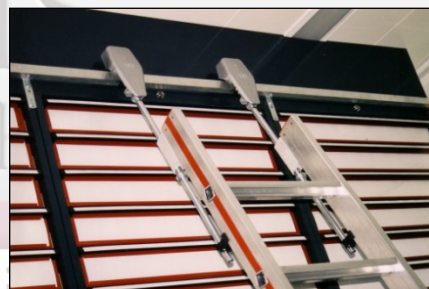
„HistoFile“- Anlage mit Spezial-Sicherheitsleiter