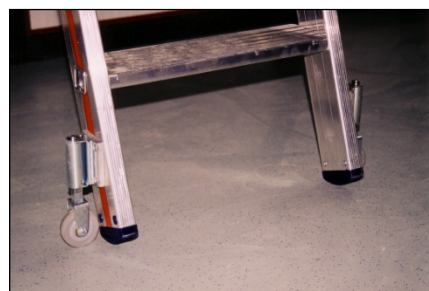
Feststell-Mechanismus der Sicherheitsleiter