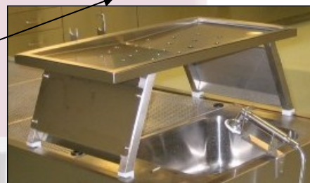
Aufsatz-Organtisch mit konkaver Zuschneide- und Lagerfläche. Mittiger Flüssigkeitsablauf. Abnehmbare Spritzbleche seitlich