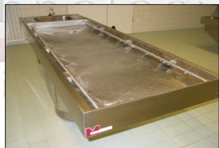
Seziertisch mit Randabsaugung und Flächenspülung