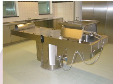
MA-0977 höhenverstellbarer Seziertisch mit im Organtisch eingehängter Brause sowie Nackenstütze

Organbecken mit 1½“ Standrohr-Überlaufventil. Warm- / Kaltwasser-Kniehebel-Mischbatterie. Flexible Brause über Organbecken, zugleich mittig im Organtisch einhängbar und über die gesamte Körperlänge verschiebbar.