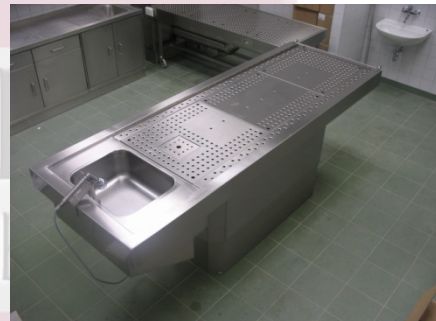
MA-0977 mit teilperforierter Arbeitsfläche, um Druckstellen zu vermeiden