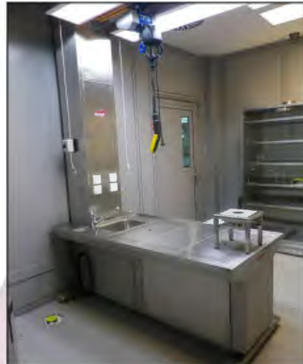
MA-2069 Tier-Sektionstisch mit Abluft und Kranbahn für optimale Kadaver-Positionierung

1 x Kranbahn für optimale Positionierung der Kadaver vor der Sektion.